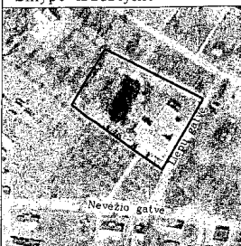
Skipto išdėstymo schema